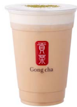
チャイ ミルクティー +ミルクフォーム