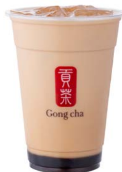
チャイ ミルクティー

シナモン、ナツメグ、バニラ、クローブ、オールスパイスの複雑な風味が刺激的なフレーバーミルクティー。エキゾチックな気分になりたい時におすすめ。ほんのりしょっぱい『ミルクフォーム』をトッピングするとミルクィなチャイを楽しめます。