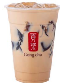
杏仁 ミルクティー +グラスジェリー