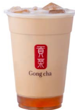
塩キャラメル ミルクティー

濃厚な甘さを塩で引き締めた、キャラメルの風味豊かなミルクティー。『パール』をトッピングすると、黒糖の香りがかわり、さらに濃厚でやさしい味わいに。