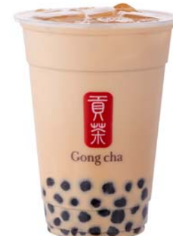
塩キャラメル ミルクティー +パール

※全ての商品はホットのご用意もございます。ホットはS、Mサイズの展開となります。