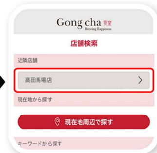
「店舗検索」から お受け取り店舗を選択