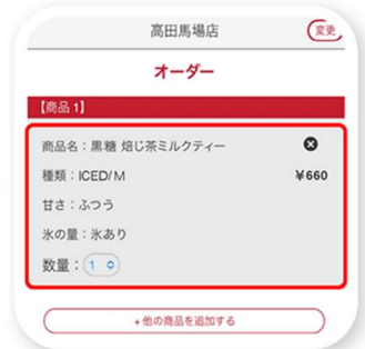
オーダーメニューを確認後 決済方法を選択し、お支払い