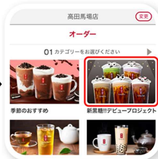
「新黒糖!!デビュープロジェクト」 カテゴリの中から 商品・カスタマイズを選択