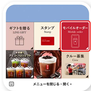
ゴンチャ公式アカウント リッチメニューから 「モバイルオーダー」をクリック

■公式SNS URL：Twitter https://twitter.com/gongcha_japan Instagram https://www.instagram.com/gongcha_japan/