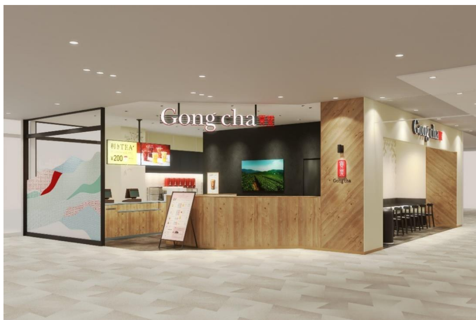
ゴンチャ アミュプラザ長崎店イメージ画像

今後も、Gong chaは日本各地のお客さまに上質なお茶をお気軽にお楽しみいただけるよう、新たなティーカルチャーの創造と拡大を進めてまいります。