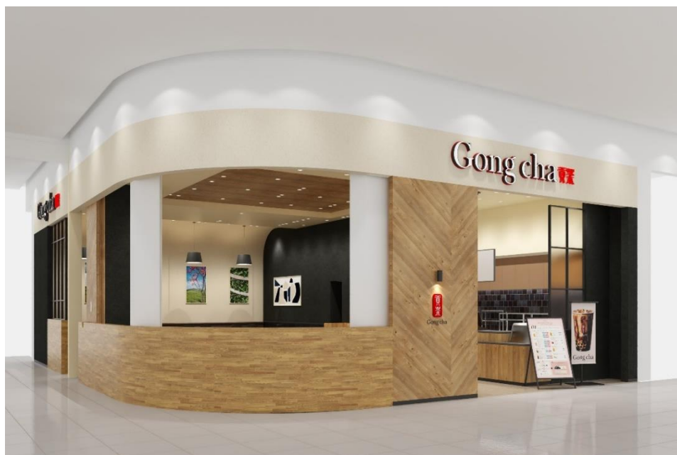
※ゴンチャ イオンモール羽生店イメージ画像

※日本国内13チェーンを対象にしたデスクリサーチ（株式会社ショッピングアイ）より／2022年2月時点