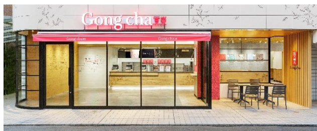
（原宿表参道店 外観）

お茶と並ぶゴンチャ自慢の一品が、パール（タピオカ）です。その輝きが黒い真珠のように見えることから名付けられたとも言われ、ミルクティーとの相性も抜群です。本場台湾から直輸入し、台湾直伝のレシピを用いて、お茶と同様に毎日数回、店舗で丁寧に仕込んでいます。ゴンチャ独特の、大粒で、もちもちとした食感、やわらかな糖の甘みにあふれた、自慢のパール（タピオカ）をぜひお楽しみください。