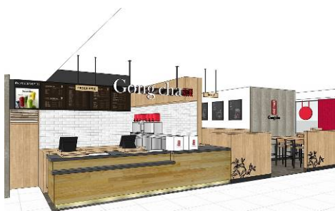
エキュート赤羽店 イメージ